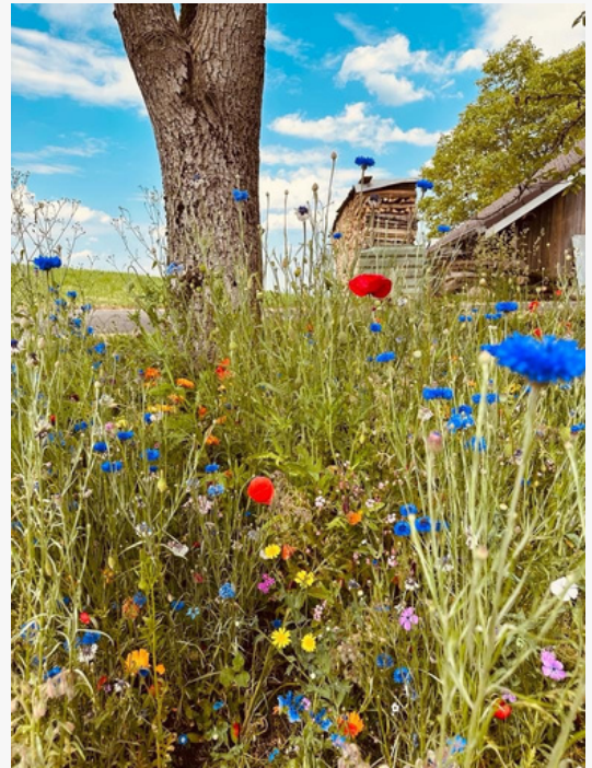
Natur und Hof