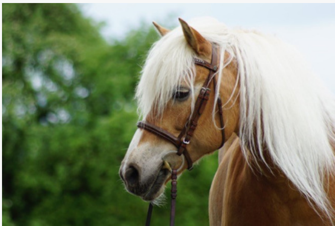
Unser Pferd Arve